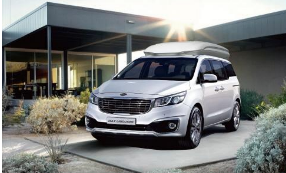
스노우 화이트 펄 Snow white pearl