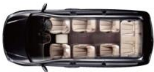
| 7인승 올뉴카니발 리무진 개조