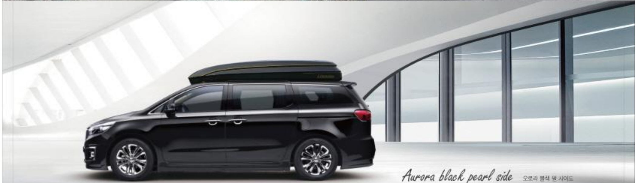
Aurora black pearl side 오로라 블랙 펄 사이드